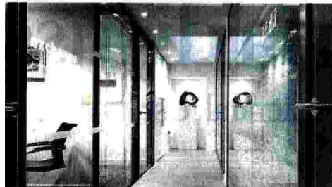
A tutto export. A destra, lastre di ceramica Laminam in una stazione ferroviaria in Nuova Zelanda. Qui a sinistra, lo studio Morgan Lowell a Londra