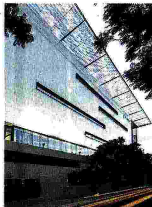
Pareti. Un palazzo in Sudafrica

« Laminam è nata così, per portare sul mercato un prodotto che non esisteva - racconta l'ad dell'azienda modenese -. C'è una domanda straordinaria