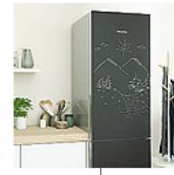
Valcucine Genius Loci , design G. Centazzo. Legno intagliato e intarsiato, pietre e metalli