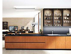
Euromobil Antis Cucina con la finitura Fusion che simula superfici metalliche spazzolate