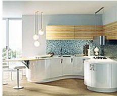
Aster Nuova Domina , design L. Granocchia. Linee curve per le basi laccate bianco e massima linearità per i pensili in legno di ulivo