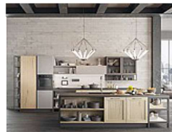
Arredo3 Asia Factory . Dalla fusione della cucina Asia, in rovere, con gli elementi di Factory, in acciaio brunito