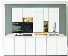
Team7 Cucina Linee. Struttura in massello con finitura in vetro colorato. Dettaglio di spicco: la cornice a contrasto in vetro