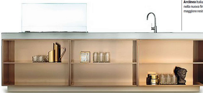
Arceina Italia , design Antonio Citterio, nella nuova finitura Pvd che dà maggiore resistenza all'usura