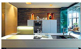
Frames by Franke Design Studio Noa. Sistema modulare di 67 elementi in cristallo nero o champagne, con cornice d'acciaio