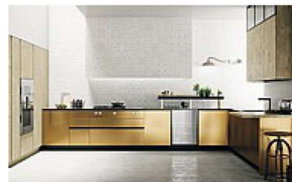
Dolmo Cuche Soho . Le basi in laccato effetto ottone graffiato, contrastano con il legno dei pensili, del piano snack e delle colonne. Completa il progetto l'anta a telaio in vetro armato