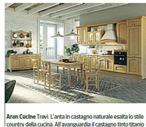
Aran Cuche Trevi . L'anta in castagno naturale esalta lo stile country della cucina. All'avanguardia il castagno tinto titanio