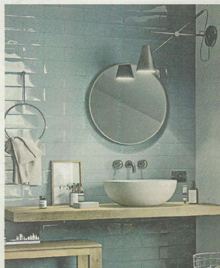
SMALL ERETRO Il ritorno del piccolo formato per un bagno retrò, qui nella versione morbida ed extra lucida della monocottura Mellow di Marazzi

di pavimentazioni lignee propone parquet di grande formato per "ingrandire gli ambienti", affermano dall'azienda. Oppure chi, come lo studio Job, introduce nella collezione di Bisazza teschi e macabri animali stilizzati, «perché gli scheletri, violenti e innocenti, con le loro forme grafiche e dirette, raccontano il nostro tempo, che è stravagante e travolgente». Insomma, se ne vedranno davvero di tutti i colori e decori. E a volte sarà necessario indossare un caschetto visore. Emilceramica invita nel virtual tour al Superstudio Più di via Tortona 27 per immergersi nella realtà aumentata. Nel percorso sembrerà di essere protagonisti di un videogame.