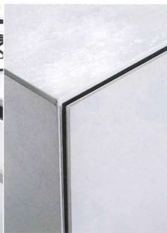
キッチンスペースで多用した磁器質タイルの「ラミナム」。見る角度によって、微妙なテクスチャーが現れる。傷がつきにくいのも特徴。